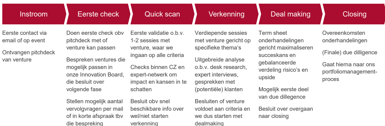
Figuur 2: Ons proces

Om goed te kunnen samenwerken hebben we ons proces opgebroken in zes stappen. Om ervoor te zorgen dat we snel richting besluitvorming kunnen gaan en tegelijkertijd innovatoren niet overvragen, hebben we per stap gedefinieerd hoe we willen samenwerken en waar we op letten. Belangrijk: een volgende stap betekent nooit automatisch dat we gaan investeren. Iedere overgang is een expliciete go/no-go.